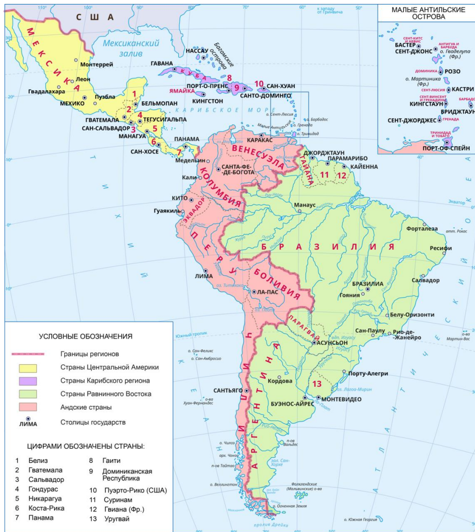
Рисунок 1. - Субрегионы Латинской Америки

Англоязычные страны — Ямайку, Барбадос, Багамы, Белиз и другие — часто не относят к Латинской Америке.